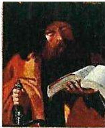
Portraits de deux apôtres, début 17 e siècle, huile sur toiles, H. 79, L. 81.