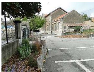
Une cour bientôt en manque d'enfants?