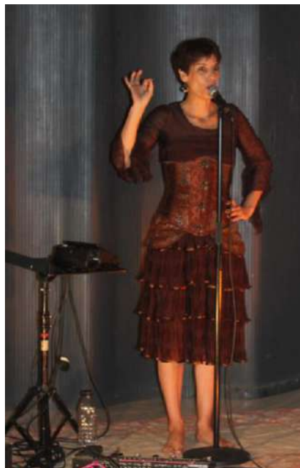
La comédienne Farouche Devah