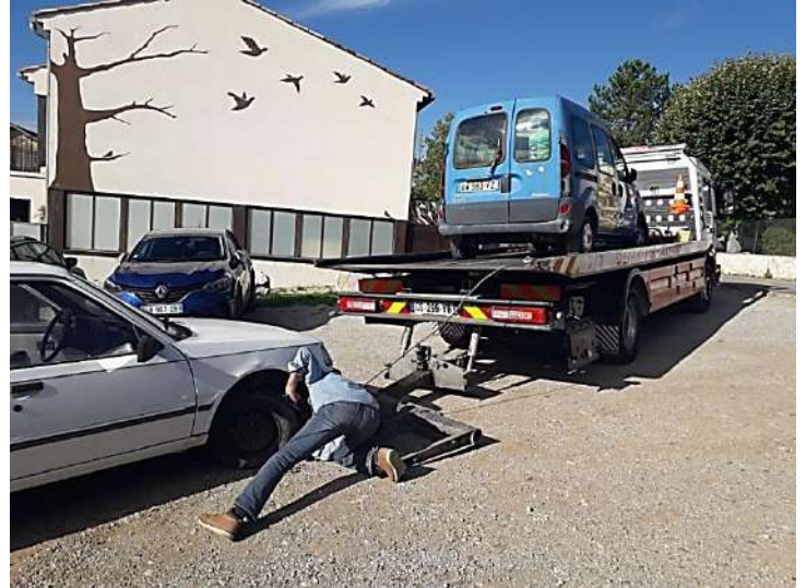
Chargement d'un véhicule par la fourrière à Reillanne, septembre 2024.

véhicules pour les communes ne disposant pas d'une police municipale. Mais ce sont au final toujours les contribuables qui paient la note pour ces automobilistes indécents et peu soucieux de la collectivité.