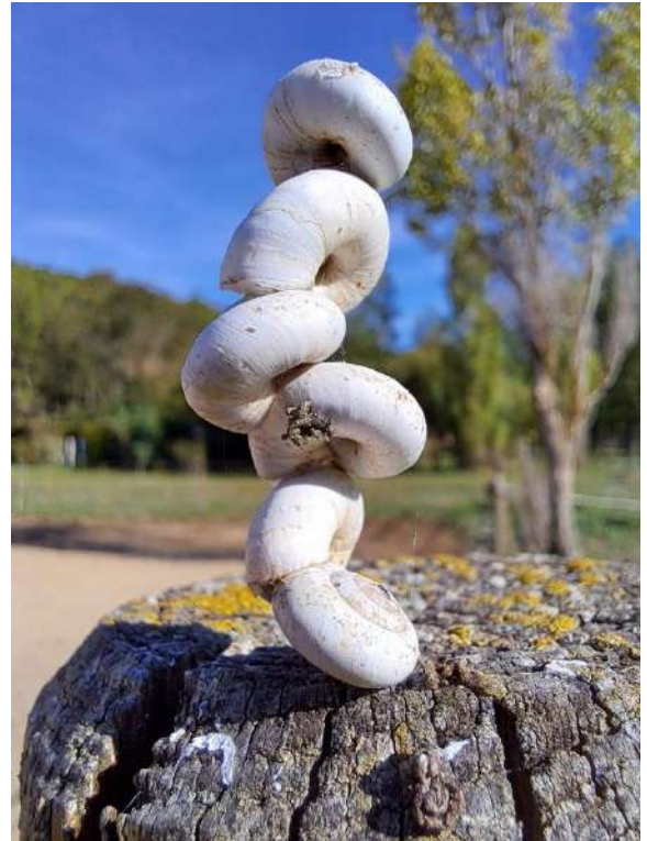
En équilibre ...

Grappe de Xeropicta derbentina en estivation, août 2024, chemin du Cai, à Reillanne.