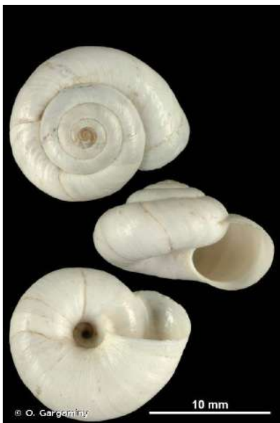
Coquille de X. derbentina , avec les spires, l'ouverture, et l'ombilic en dessous.