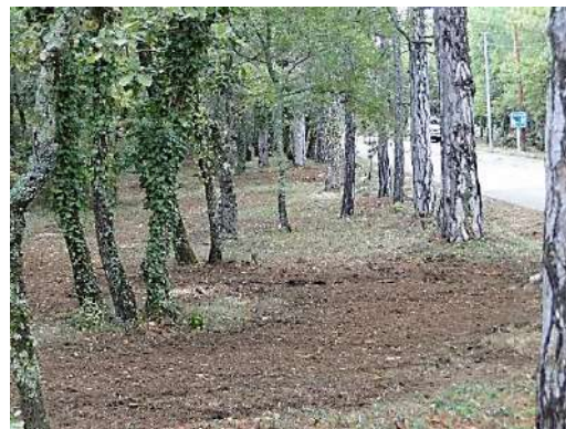
L'espacement entre les branches des arbres, et non les troncs, doit respecter deux mètres.