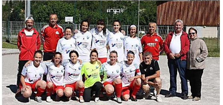
L'équipe féminine lors de la dernière de la Coupe des Alpes

Les participants à ces séances ou compétitions concernent les joueurs /joueuses/dirigeants détenteurs d'une licence FFF .