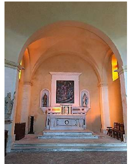
Intérieur de la chapelle Saint-Denis avec son éclairage naturel.