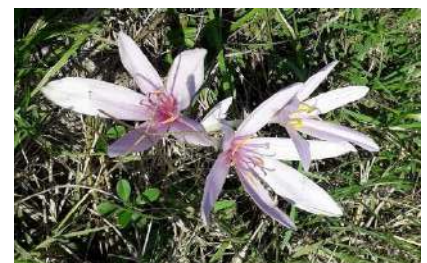
Colchiques dans les prés...