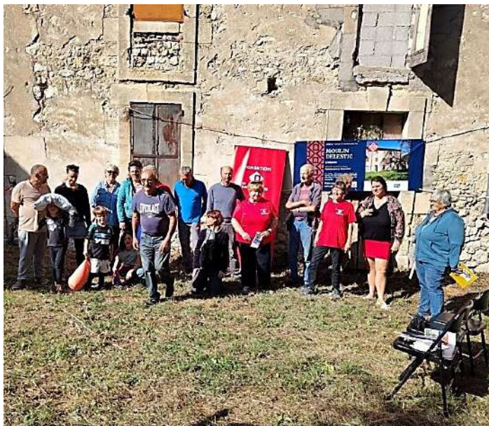
Au moulin Délestic, après la randonnée d'orientation, avec la Fondation du Patrimoine 04