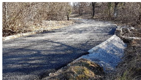
Route du Largue