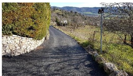
Chemin des amandiers