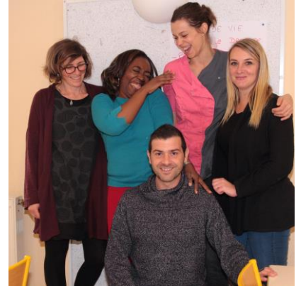
Le personnel de l'école et de la cantine