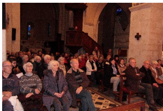
Le public est transporté....