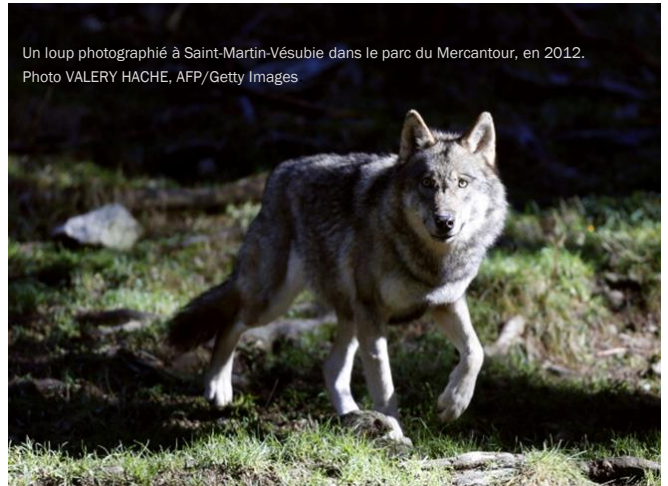
Un loup photographié à Saint-Martin-Vésubie dans le parc du Mercantour, en 2012.

Depuis plusieurs mois, les éleveurs ovins de la commune de Reillanne et des alentours subissent régulièrement des attaques contre leurs troupeaux. Un grand nombre de brebis ont été tuées ou blessées, et le traumatisme est grand pour les éleveurs, surtout quand les attaques sont récurrentes. Suite à la multiplication de ces dernières à Reillanne, la « brigade loup » de l'Office français de la biodiversité (OFB) est intervenue dans notre commune à plusieurs reprises. Cette brigade participe aux opérations de défense des troupeaux, en assurant une présence auprès des éleveurs connaissant une récurrence d'attaques exceptionnelle. Courant mai, après plusieurs jours de surveillance par ces experts en faune sauvage, une louve a été tuée dans la commune. Suite à ce prélèvement, la pression sur les éleveurs est redescendue quelque peu, mais cela n'a pas duré. Quelques jours plus tard, une nouvelle attaque a eu lieu à Reillanne derrière le lotissement des Terres blanches, durant laquelle deux brebis, toutes